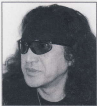
◆構成・音楽 寺本建雄 (LALALA Office LLC)

ガレキの中を両親の名を呼びながらガレキを死に物狂いでよけました。発見しました。ゴメン！ O・63才 元技術職